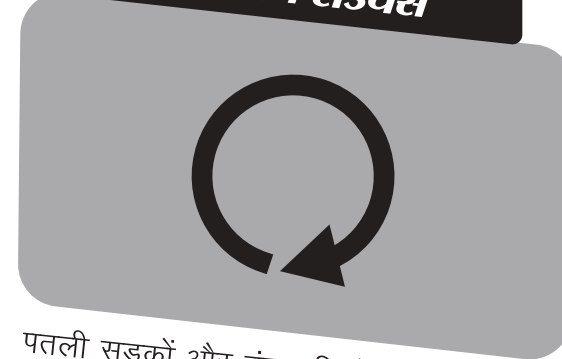
कम टर्निंग रेडियस

लाइट फ्रेम के चलते मोटरसाइकल का वज़न बहुत ज़्यादा नहीं होता जिससे इसे संभालना आसान होता है। इसका ड्युरेबल / टिकाऊ और मजबूत फ्रेम हर तरह की सड़क के लिए कामयाब है और भार लादने की भी सुविधा देता है।