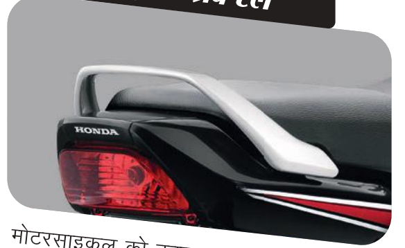
स्ट्रॉन्ग ग्रैब रेल