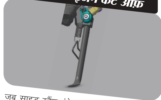
साइड स्टैंड इंजन कट ऑफ

जब साइड स्टैंड इंगेज हो और व्हीकल को गियर पर डाला जाए तो राइडर की सुरक्षा के लिए ये इग्निशन को कट ऑफ कर देता है।