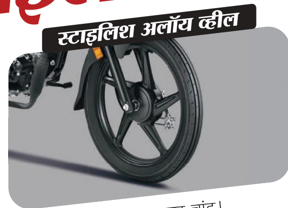
स्टाइलिश अलॉय व्हील