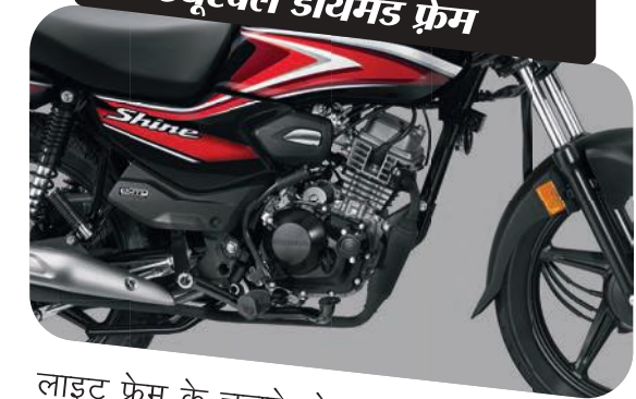
लाइट वेट और ड्युरेबल डायमंड फ्रेम

लाइट फ्रेम के चलते मोटरसाइकल का वज़न बहुत ज़्यादा नहीं होता जिससे इसे संभालना आसान होता है। इसका ड्युरेबल / टिकाऊ और मजबूत फ्रेम हर तरह की सड़क के लिए कामयाब है और भार लादने की भी सुविधा देता है।