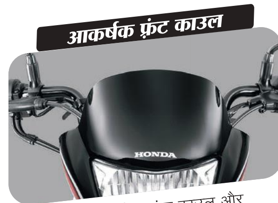
आकर्षक फ्रंट काउल

टैंक के साथ साइड ग्राफिक्स की खूबसूरती बढ़ाए आपकी शान।